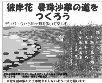
河原にたてる看板です！

河川部会では昨年からは半場川の堤防に彼岸花の球根を植えて管理をしています。今年も5月～6月にかけて草刈りや球根の追加植え付けの作業をしています。除草剤の散布や土手焼きをされないようご協力お願いします。2年後の彼岸頃に綺麗に咲く予定です。是非散歩してみてください。