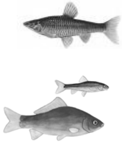
戻ってきたモツゴやフナなどの在来種

外来種を退治した現在は、ハスが復活し、在来種のモツゴ、スジエビなど生態系がよみがえり、見事昔の風景が見られるようになりました。7月～8月が見ごろです。ぜひご覧ください。