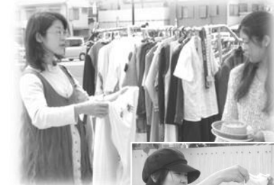
成長の早い 赤ちゃんの服 も賢く品定め