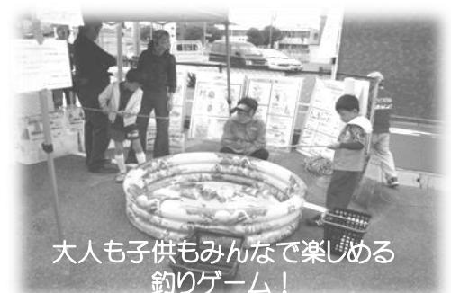
大人も子供もみんなで楽しめる 釣りゲーム!